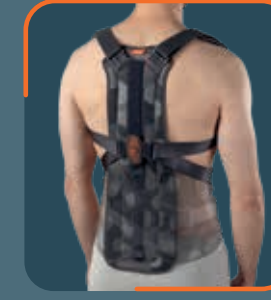
Option: REF. 90074 Schienale per spallaccio DorsoPull 74