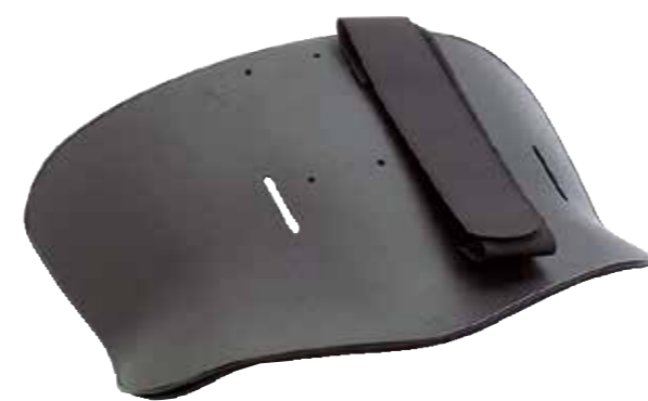
OPTION: P.T1030P Abdominalpelotte, erhältlich in 3 Größen

Innovatives Spannsystem mit Flaschenzug-Technik zur optimalen Stabilisierung und für einfaches Anlegen bei minimalem Kraftaufwand.