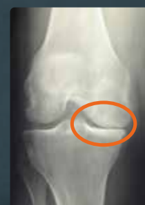
Stosowana w artrozie

W leczeniu bólu, do momentu interwencji chirurgicznej, oprócz podejścia farmakologicznego, bardzo ważne jest posiadanie aparatu ortopedycznego zdolnego do złagodzenia objawów, przywracając tym warunki życia bardzo zbliżone do normalnych.