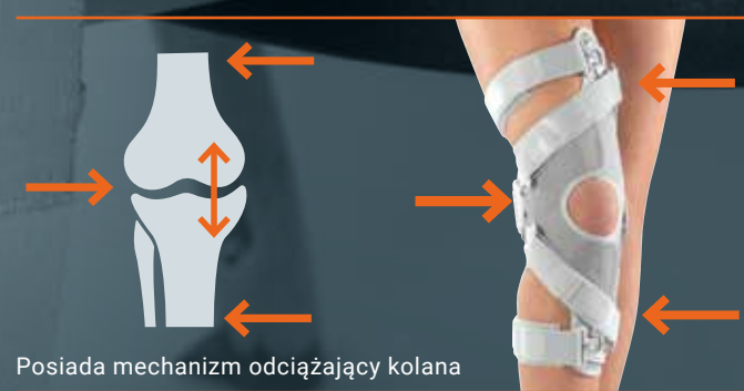
Posiada mechanizm odciążający kolana