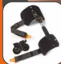
REF. 91007 - Asta articolata per Hipocross

Headquarter: ORTHOSERVICE AG Via Milano 7 · CH-6830 Chiasso (TI) · Switzerland Tel. 0041 (0) 91 822 00 88 · Fax 0041 (0) 91 822 00 89 info@orthoservice.com · www.orthoservice.com Niederlassung Deutschland: Orthoservice Deutschland GmbH Flugstraße 8 · D-76532 Baden-Baden · Deutschland Tel. 0049 (0) 7221 991 39 11 · Fax 0049 (0) 7221 991 39 13 info@orthoservice.de · www.orthoservice.de ORTHOSERVICE POLSKA sp. z o.o. ul. Warszawska 416a · 42-209 Częstochowa Polska Tel.: +48 (0) 34 340 13 10 www.orthoservice.pl · info@orthoservice.pl Sede italiana: RO+TEN s.r.l. Sede legale: Via Marco De Marchi, 7 · I-20121 Milano (MI) · Italia Sede operativa e amministrativa: Via Comasina, 111 · I-20843 Verano Brianza (MB) · Italia Tel. 0039 039 601 40 94 · Fax 0039 039 601 42 34 info@roplusten.com · www.roplusten.com Società soggetta a Direzione e Coordinamento (art. 2497bis CC); Orthoservice AG (CH) 6830 Chiasso (TI) · Switzerland