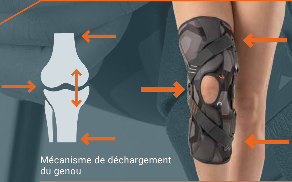
Mécanisme de déchargement du genou