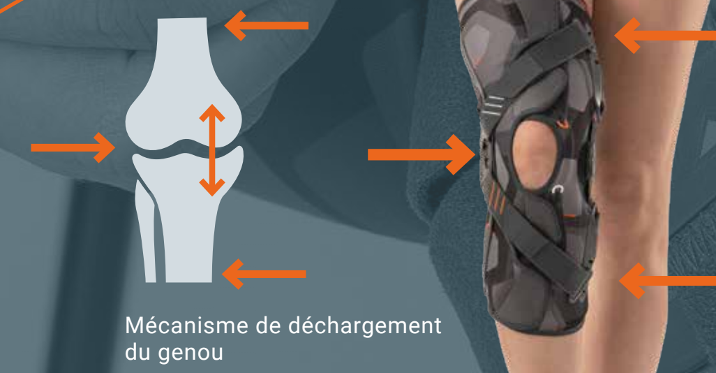
Mécanisme de déchargement du genou