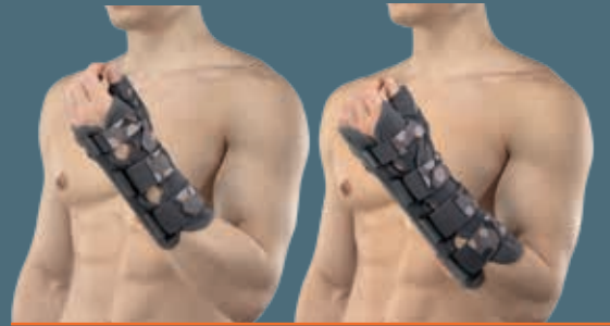
UniCarpo23 kombiniert mit UniCarpo19